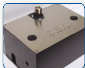
Cassetta in acciaio (catalforesi) con coperchio in acciaio inox. Disponibile cassetta completa in acciaio inox o zincata a caldo