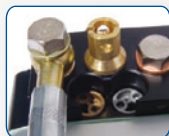
Valvole di regolazione forza e sistema di sblocco