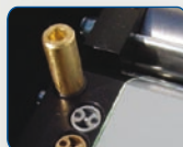
Valvole di regolazione forza e sistema di sblocco