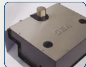
Cassetta in lamiera zincata con battute meccaniche regolabili coperchio in acciaio inox