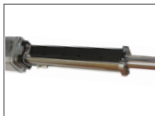
Encoder lineare assoluto (opzionale)