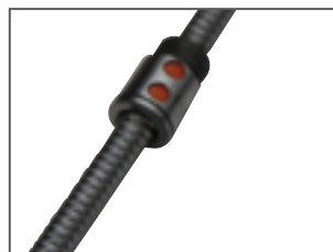
Vite a ricircolo di sfera