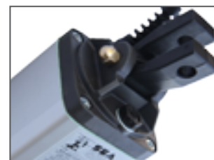
Attacco oscillante posteriore