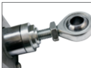
Snodo sferico su stelo