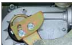
Adjustable mechanical stop in opening and closing Stop meccanici regolabili in entrambe le direzioni.