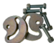
12715210 PSFO Mechanical stops in opening for FIELD DOUBLE Battuta meccanica in apertura per FIELD (di serie si FIELD OIL) n. 2 pz.