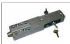
Plus release with lever and security lock Sbocco Plus con leva e serratura di sicurezza.