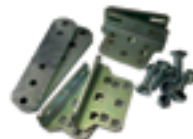
Staffa attacchi posteriori regolabili senza saldatura (n.2 pezzi)