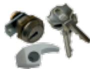
Cilindro con chiave DIN dedicata 10 cifrature e leva di sblocco