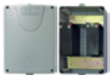
Batterie con scatola (7AH)