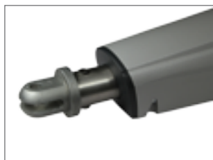
Attacco in punta con staffa a saldare o avvitare