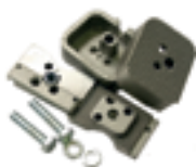
Stop meccanici in chiusura (2 pezzi)