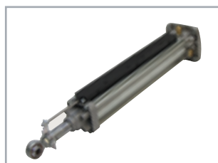
POSITION GATE Encoder assoluto lineare (opzionale)