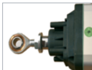
Snodo sferico per regolazione millimetrica della corsa