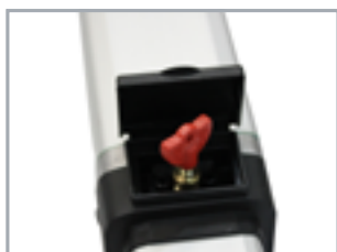
Sistema di sblocco con nuovo design e chiave personalizzata SEA