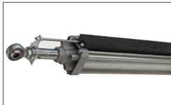
POSITION GATE Absolute Linear Encoder (optional) Encoder assoluto lineare (opzionale)

Su richiesta versioni con rallentamento idraulico per un dolce accostamento delle ante in chiusura