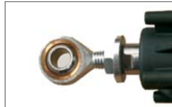
Round joint for stroke management Snodo sferico per regolazione millimetrica in caso di ante non perfettamente allineate