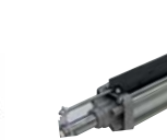
12711065 POSITION GATE HT270* Absolute linearencoder with extrusion and joint Encoder lineare assoluto con estruso e giunto