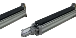
12711070 POSITION GATE HT390* Absolute linear encoder with extrusion and joint Encoder lineare assoluto con estruso e giunto