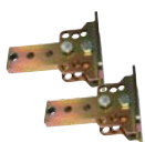
12715070 BRA Adjustable back brackets to screw n.2 pcs Staffa posteriore regolabile da avvitare n.2 pezzi