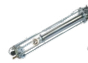
12710490 LSHT270 Kit mechanical/electronic limit switch for HALF TANK 270 Finecorsa meccanici/elettronici per HALF TANK 270