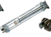
12710495 LSHT390 Kit mechanical/electronic limit switch for model 390 Finecorsa meccanici/elettronici per HALF TANK 390