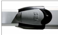
Metal release system PLUS with lock (optional for 270 stroke) Sistema di sblocco PLUS in metallo accessibile con serratura (optional per versione corsa 270)