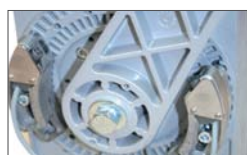
Adjustable mechanical and electronic limit switches in opening and closing (only for FLIPPER PLUS)

Finecorsa meccanici ed elettronici regolabili in apertura e chiusura. (di serie su FLIPPER PLUS)