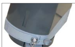
Release system through aluminum lever and safety lock (only for FLIPPER PLUS)

Finecorsa meccanici ed elettronici regolabili in apertura e chiusura. (di serie su FLIPPER PLUS)