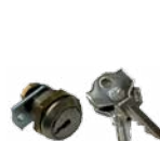
12710677 DIN cylinder with variable coding (1 pc) Cilindro con chiave DIN dedicata 10 cifrature (1 pz)