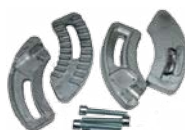
12710412 LSFM kit mechanical limit switch in opening and closing for one FLIPPER DOUBLE 24V BASIC Finecorsa meccanico (2 pz) per KIT FLIPPER DOUBLE 24V BASIC