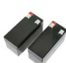
23106340 BAT 1,2 Small batteries for FLIPPER 1,2 AH 1,2 Mini batterie per FLIPPER 1,2 AH