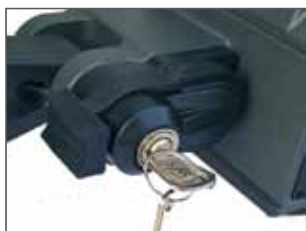
Sblocco con chiave (in opzione)