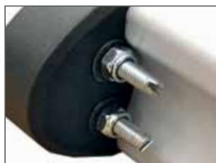
Finecorsa elettronici regolabili sull'operatore (di serie sulla versione PLUS su richiesta)