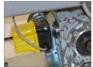
Finecorsa meccanico a leva