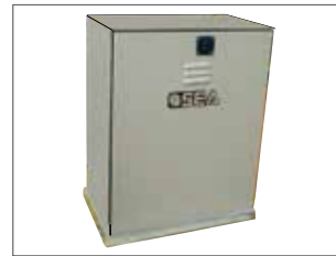
Cover in acciaio inox