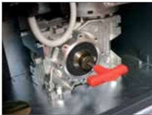
Sblocco manuale con chiave personalizzata