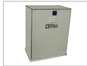
Cover in acciaio inox