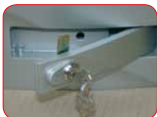
Sblocco con leva di alluminio e serratura di serie metallica