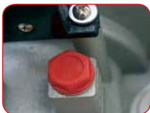
Lubrificazione degli ingranaggi in olio