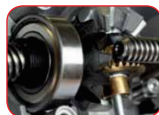
Ingranaggi e cuscinetti