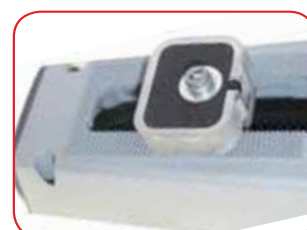
Stop meccanici/ elettronici (versioni H)