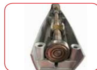
Vite senza fine supportata da cuscinetti

* (NOTA) Il ciclo di lavoro è calcolato come percentuale (%) di intermittenza di funzionamento nella 1° ora