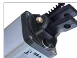
Attacco oscillante posteriore