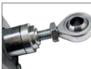
Snodo sferico su stelo