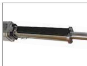
Encoder lineare assoluto (opzionale)