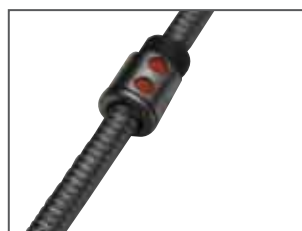
Vite a ricircolo di sfera