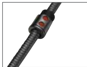
Vite a ricircolo di sfera