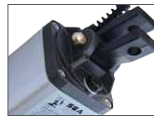
Attacco oscillante posteriore