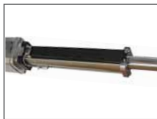
Encoder lineare assoluto (opzionale)