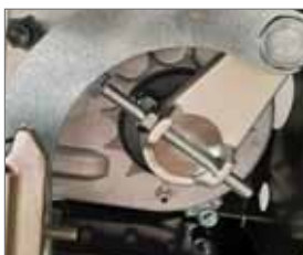
Stop meccanici regolabili in entrambe le direzioni