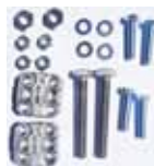
Battuta meccanica in apertura per FIELD n. 2 pz.