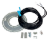
Fincorsa elettronici (solo per centrali con fincorsa)