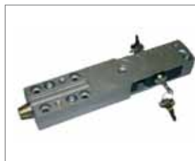
Sblocco Plus con leva e serratura di sicurezza