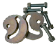
Battuta meccanica in apertura per FIELD n. 2 pz.