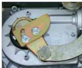
Stop meccanici regolabili in entrambe le direzioni