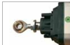
Round joint for stroke management Snodo sferico per regolazione millimetrica in caso di ante non perfettamente allineate