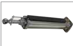
POSITION GATE Absolute Linear Encoder (optional) Encoder assoluto lineare (opzionale)

Su richiesta versioni con rallentamento idraulico per un dolce accostamento delle ante in chiusura