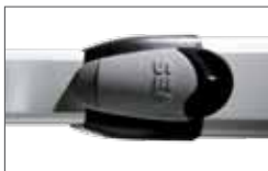
Metal release system PLUS with lock (optional for 270 stroke) Sistema di sblocco PLUS in metallo accessibile con serratura (optional per versione corsa 270)