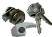
Cilindro con chiave DIN dedicata 10 cifrature e leva di sblocco