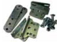
Staffa attacchi posteriori regolabili senza saldatura (n.2 pezzi)