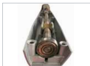
Vite senza fine supportata da cuscinetti