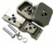
Stop meccanici in chiusura (2 pezzi)