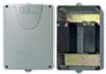
Batterie con scatola (7AH)