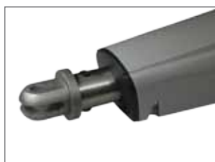
Attacco in punta con staffa a saldare o avvitare