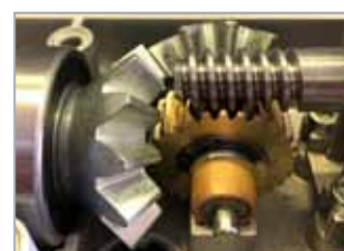
Ingranaggi e cuscinetti