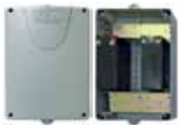
Battery kit with box