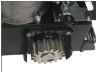
Pignone Z16 modulo 4