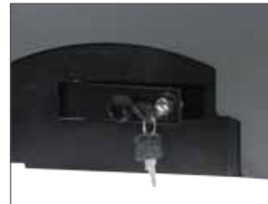
Sblocco manuale con chiave DIN