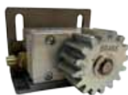
Dispositivo idraulico di frenata per cancelli in pendenza max 5° - 1500 kg