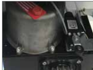
Lubrificazione in bagno d'olio