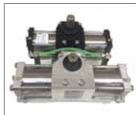
Dimensioni martinetto e Super