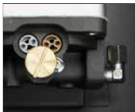
Valvole di regolazione forza