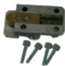
Sblocco base con olio verde per chiave speciale motori a leva