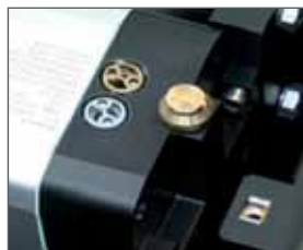
Vite regolazione rallentamento idraulico