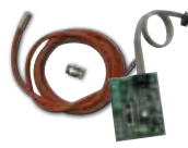
Sonda di temperatura + scheda LE + cavo 1.8 m