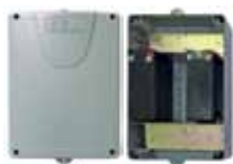
Batterie con scatola (7AH)