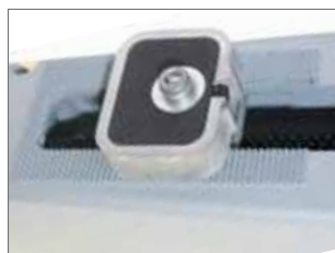
Stop meccanici/ elettronici (versioni H)