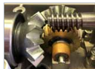
Ingranaggi e cuscinetti