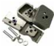
Stop meccanici in chiusura (2 pezzi)