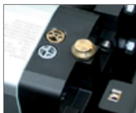
Vite regolazione rallentamento idraulico