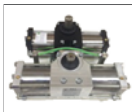
Dimensioni martinetto e Super